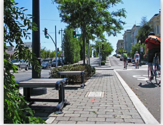
El Boulevard Octavia de San Francisco fue uno de los pocos estudios de caso destacado en el taller.

La estación 7 se centró en el proceso de opciones de evaluación para el futuro de la I-81. Un gráfico informativo ilustró este proceso y las pizarras presentaron una breve lista de las metas y objetivos del proyecto de estudio que se habían desarrollado en base a la extensión pública previa. En una serie de ejercicios interactivos, se invitó a los participantes a ayudar a delinear las metas para El Desafío I-81 . Inmediatamente después de la estación de metas y objetivos, los participantes tuvieron oportunidad de participar en grupos por temas de interés que complementaron las actividades previas y ofrecieron a los participantes otra oportunidad de compartir inquietudes, visiones, metas y objetivos en un entorno de debate grupal.