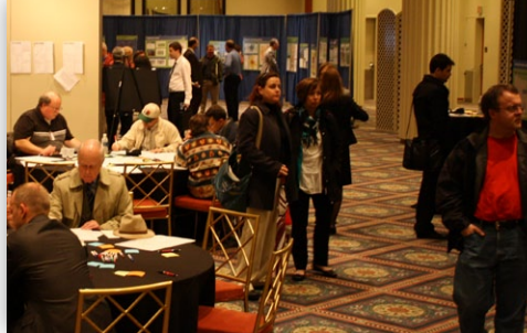
Los participantes conocieron detalles acerca del proyecto y compartieron sus opiniones e inquietudes sobre el futuro del corredor.

El SMTC y el NYSDOT ofrecieron una serie de talleres públicos abiertos para El Desafío I-81 en Oncenter en el centro de Syracuse el 3, 4 y 7 de mayo de 2011. Casi un mil residentes del área se tomaron el tiempo, en persona o a través de nuestro taller virtual, de conocer El Desafío I-81 y contarnos sus opiniones e inquietudes sobre el futuro del corredor.