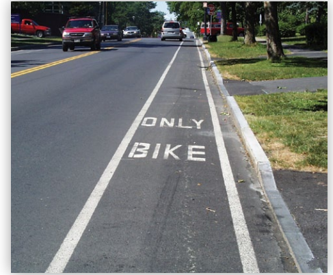
Muchos participantes ofrecieron ideas sobre el tránsito y mejoras de la experiencia de los ciclistas y peatones.