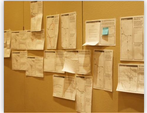
Muchos participantes publicaron sus ideas en el Muro de las Visiones en el taller.