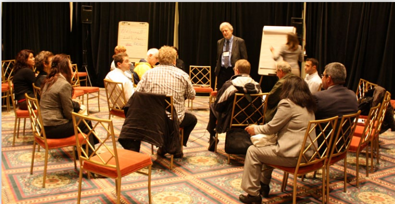
Si bien las ideas individuales sobre el futuro de la I-81 difieren, ha comenzado a emerger un conjunto de resultados deseados.

Durante los últimos meses, la gente nos ha expresado una variada gama de inquietudes, metas y visiones para el futuro de la I-81.